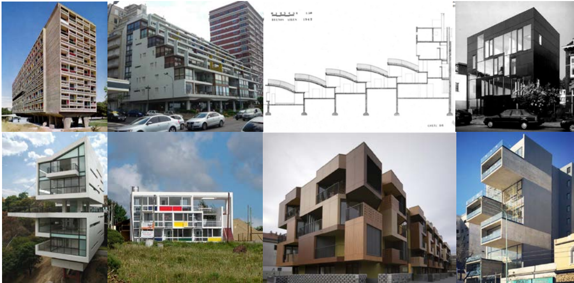
A III Referentes